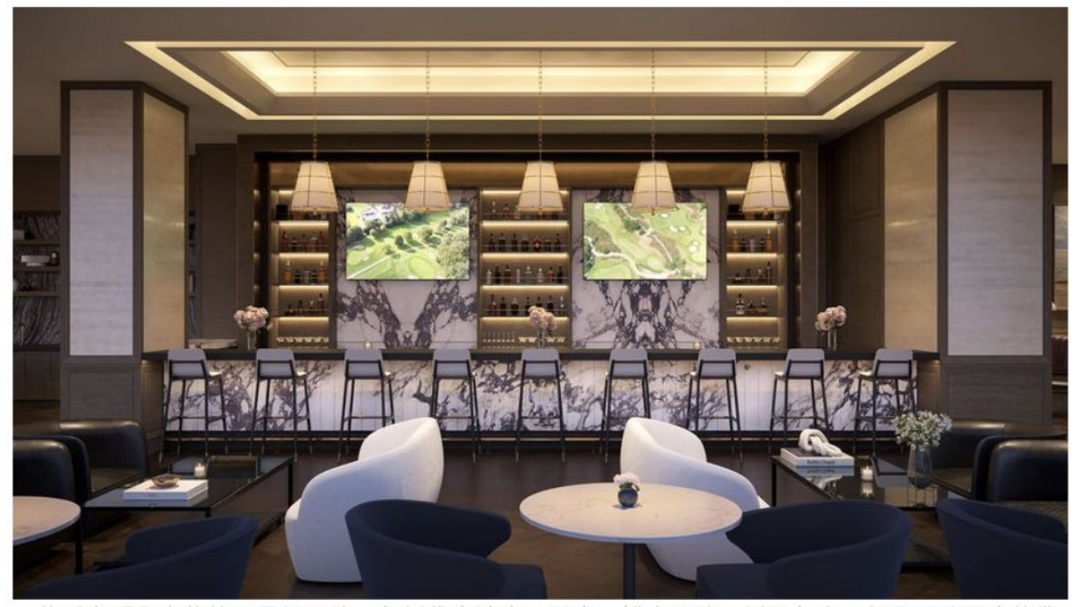
▲ 住戶享受全方位的五星級服務,包括代客泊車、門童、禮賓服務,以及包含一個全服務酒廊的業 主俱樂部。

Club VIP 計劃委由寵物專家負責,在平時有臨時「托狗」服務,不可或缺的還有為狗狗們精心設計 了一個可以自由奔跑、玩耍和社交的場地,提供寵物美容、理療、犬隻訓練、寵物營養課程,更可 以攜帶愛犬參加的歡樂時光活動,以及在新罕布什爾州農場中舉行的度假活動等。度假場地除了提 供食宿設施之外,同樣配有全方位個人化的寵物服務,為業主及愛犬的身心健康體驗融入生活中。