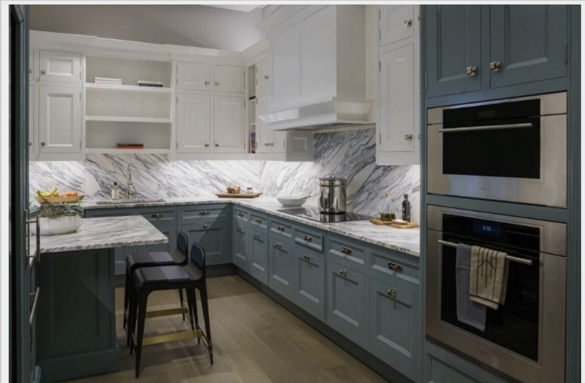
廚房使用Christopher Peacock打造的高雅櫥櫃。

此外，住宅內的廚房也很注重豪華質感與創新體驗，融入永續理念與節能電器設備，包含節能嵌入式Sub-Zero食品儲存系統、提供健康烹飪方式的對流蒸烤箱，以及比燃氣灶更健康、更安全、更節能的Wolf電磁爐灶。