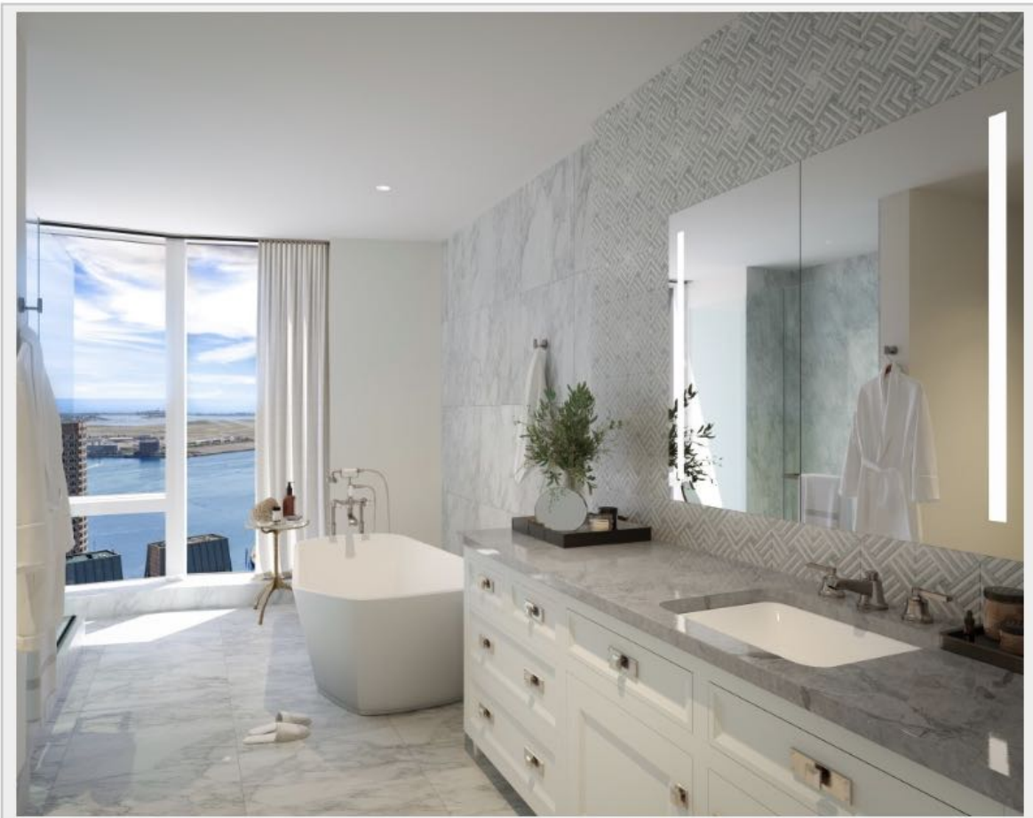
豪華浴室搭配知名設計師Christopher Peacock手工打造的櫥櫃。