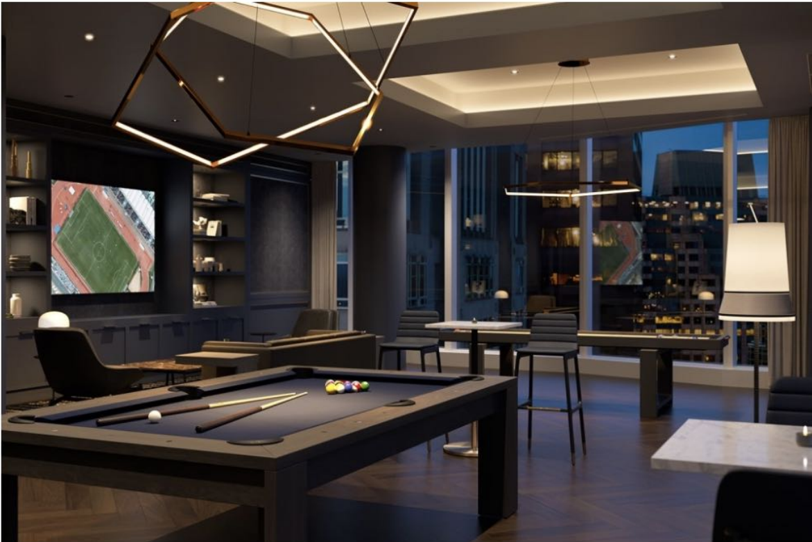
「波士頓溫斯生態大廈」的俱樂部娛樂休閒空間。

低碳生活、綠建築蔚為潮流，甚至變成豪宅的標配！美國豪宅開發商千禧夥伴集團（Millennium Partners）最新的住商開發案「波士頓溫斯生態大廈」（The Residences at Winthrop Center, Boston），以創新、節能、永續性為核心理念建造，將於2023年4月竣工。